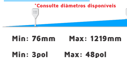
Tabela Referencial Outras medidas Sob Consulta*