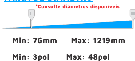
Tabela Referencial Outras medidas Sob Consulta*